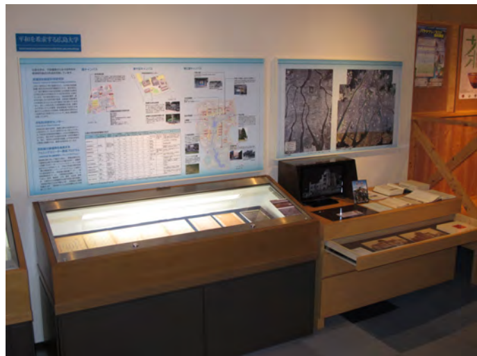
平和展示コーナーの全容

原爆ドームの金具や壁（レンガ）をはじめ、被曝した瓦の実物や原爆放射線医科学研究所が所蔵する原爆や放射線に関する文献資料などを展示。また被爆前の広島市内の様子を復元した DVD や被曝の被害などを示した地図データを見ることができる映像コーナーを設置。