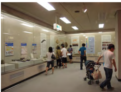
04 展示会場の様子～クジラが泳いでいた海