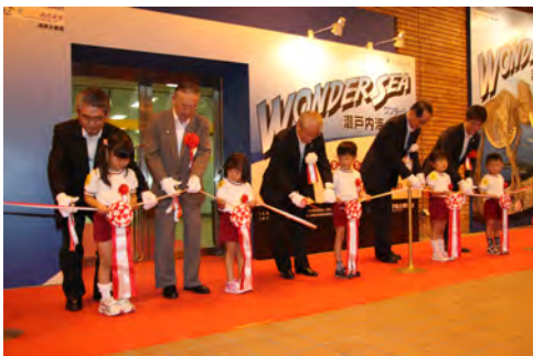
01 企画展オープニング記念式典 (7月13日)