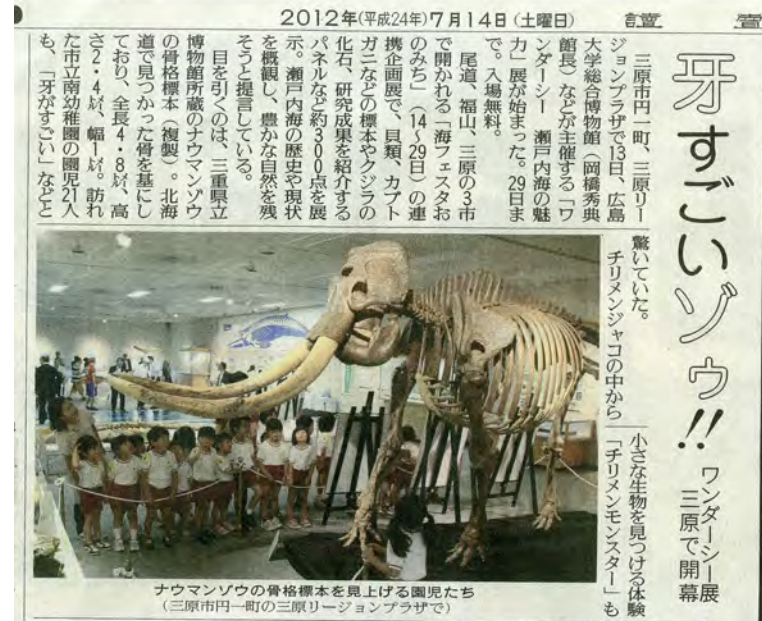
12 「読売新聞」 2012年7月14日