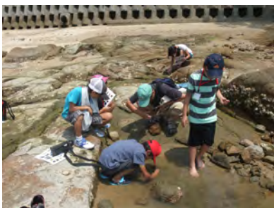
07 小佐木島観察会 (7月28日) 参加者44名