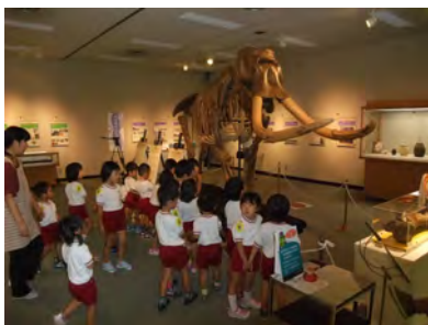
05 展示会場の様子～ナウマン象の全身骨格