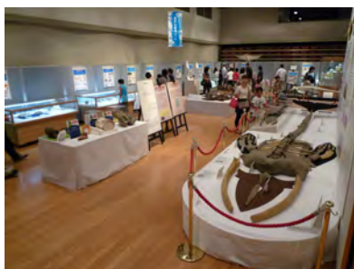
10 展示会場の様子 (福山)