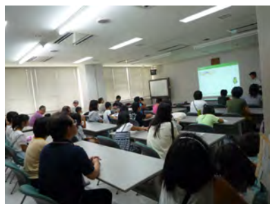
11 講演会 (8月11日) 来場者60名