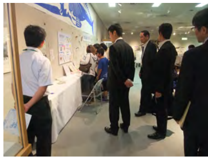
02 湯崎広島県知事来場