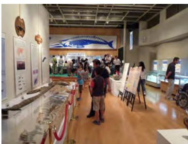
09 展示会場の様子 (福山)