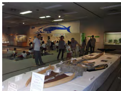
06 展示会場の様子～ショウバラクジラ化石