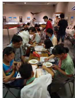
03 展示会場の様子 チリモンコーナー